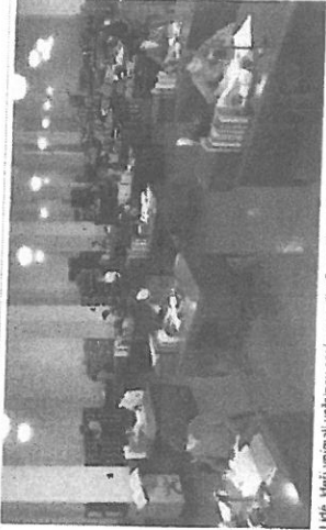
Lidé, kteří vnímali veřejnou správu pozitivně, chodí na úřady málo. Ti, kteří jí nemají v oblibě, jsou na úřadech mnohem častěji.

Nejnavštěvovanějším úřadem v České republice je bezesporu obecní úřad, případně magistrát, kam opakovaně zavítá necelá polovina Čechů a Češek. Častěji úřady navštěvují lidé s maturitou či vysokoškolským vzděláním a také lidé z větších měst. říká výzkum vědců a vědkyň z Průvratné ekonomické fakulty brněnské Mendelovy univerzity.