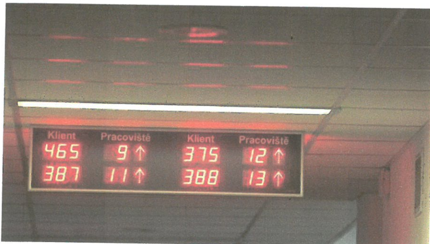
(ilustrační snímek)

Čeští úředníci jsou arogantní a nezajímají se o názory občanů. Takové jsou nejčastější výtky vůči státní správě. Zjistili to výzkumníci z Provozně ekonomické fakulty Mendelovy univerzity v Brně, kteří se lidí ptali na to, jak hodnotí kvalitu úřadů.