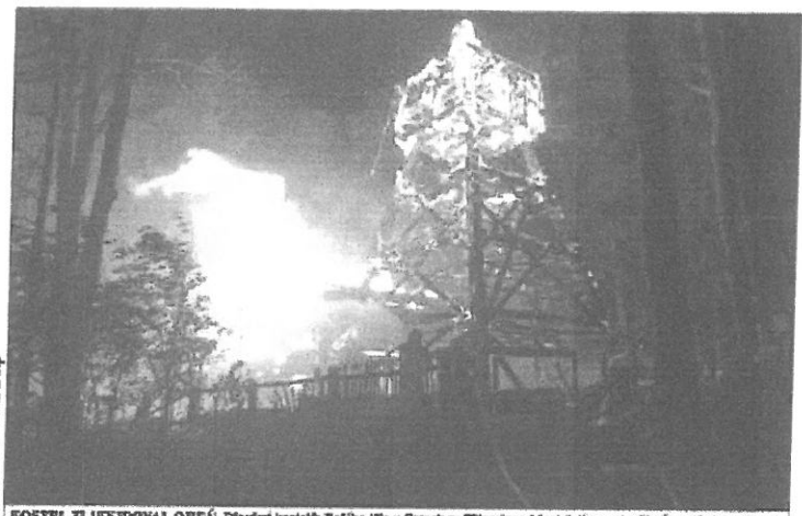
KOSTEL ZLIVY HOVAL OHEŇ. Dívčí věž kostela v obci byla v Ouzach na Třinecku z 16. století v noci z ohně a středu zcela zničena plameny. Přiváženi žánři v lože a jedoucí a vyjetí dle dřívějších památek a má moc dle státních.